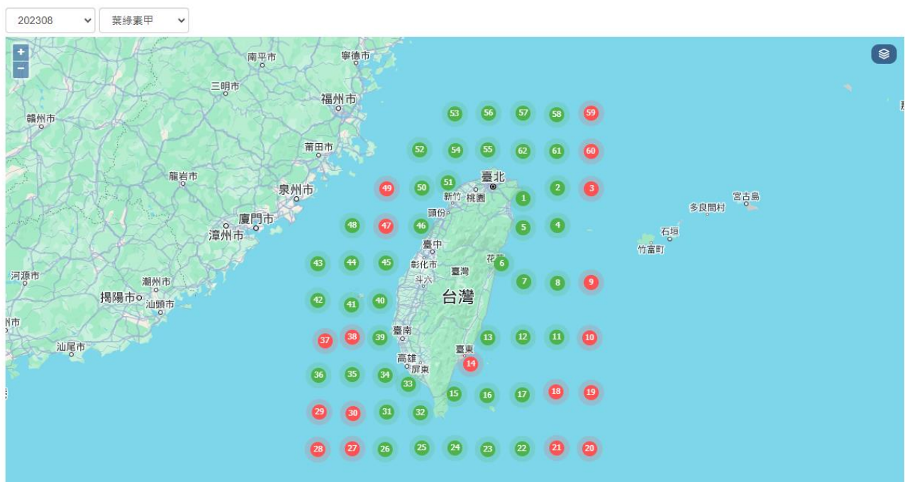
資訊儀錶板示意圖